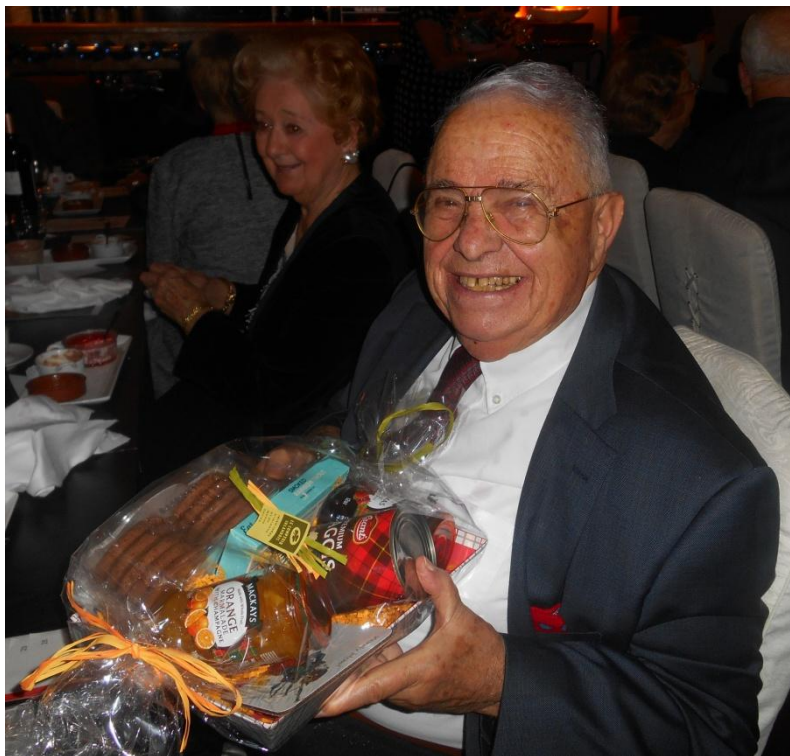
Repas de Noël 2016