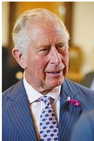
HM The King Charles III, Duke of Lancaster

The Duchy of Lancaster is a private estate owned by His Majesty The King, as Duke of Lancaster. The rural estates consist of 44,748 acres of land in England and Wales and comprise commercial, agricultural and residential properties, the majority of which are in Lancashire, Yorkshire, Cheshire, Staffordshire and Lincolnshire. Additionally the Duchy has a significant commercial property portfolio largely in the Savoy precinct off the Strand in London, a portfolio of financial investments and a small urban residential portfolio.